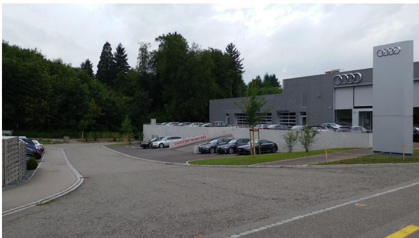
Vollsperrung der Winkelstrasse aufgrund des Deckbelagseinbau

Auf der Winkelstrasse wird am Wochenende vom 10./11. Juni 2017 der Deckbelag eingebaut. Während den Vorarbeiten vom 7. bis 9. Juni 2017 kann die Winkelstrasse mit gewissen Einschränkungen weiterhin befahren werden. Ab 10. Juni 2017, 06.30 Uhr, bis 12. Juni 2017, 06.00 Uhr, ist die Winkelstrasse für jeglichen Verkehr gesperrt. Den Anwohnern und den Verkehrsteilnehmern wird für das Verständnis gedankt.