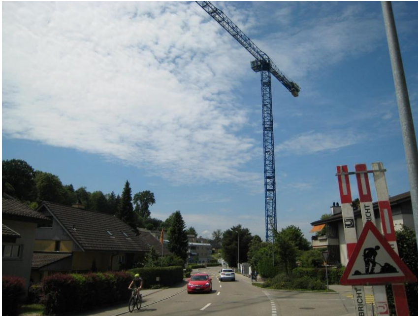
Demontage des Baustellenkrans verursacht die einseitige Sperrung der Dorfstrasse

Bei den neu erstellten Terrassenhäusern an der Dorfstr. 21 wird am Mittwoch, 14. Juni 2017 der Baustellenkran demontiert. Für die Demontage und für den Abtransport des Krans muss die Dorfstrasse ab 06.30 Uhr bis längstens 18.00 Uhr einseitig gesperrt werden. Die Verkehrsteilnehmer werden gebeten, den Anweisungen des Verkehrsdienstes Folge zu leisten.