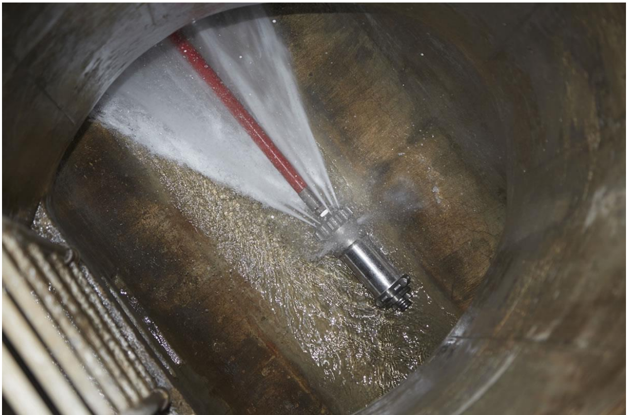
Leitungsspülung im Untergrund

Die Firma Franz Pfister AG, Birmenstorf, wurde mit der Entleerung von rund 620 Strasseneinlaufschächten beauftragt. Diese Arbeiten beginnen am 8. Mai 2017 und dauern etwa eine Woche. Die Kosten von ca. CHF 12'000 sind im Budget 2017 eingestellt.