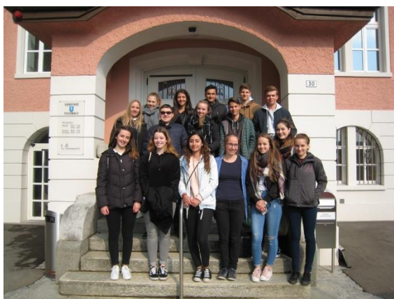
Die Teilnehmenden vor dem Gemeindehaus Fislisbach