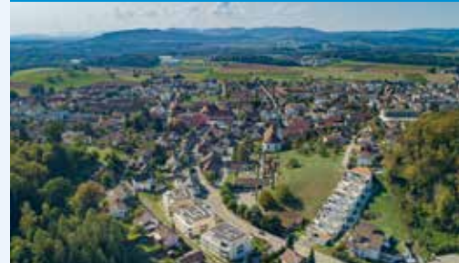
Blick über den Dorfkern von Fislisbach in Richtung Westen.