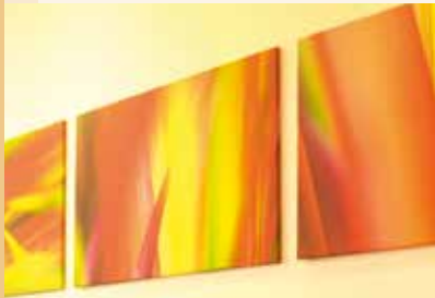
Kunst – gern gesehen in Fislisbach.

Sport, Unterhaltung, Freizeit, Kulinarisches, Kulturelles und vieles mehr – Fislisbach bietet ein breites Angebot an Möglichkeiten der aktiven Freizeitgestaltung. Über 50 Vereine und Organisationen bereichern und fördern das Gemeindeleben. Das vielfältige Angebot bietet Personen, die Fislisbach als Lebensraum auswählen, sowohl gesellige, kulturelle und sportliche Begegnungen als auch kameradschaftliche Kontakte. Mehrere Turn- und Sportvereine betreiben – ergänzend zur Jugendarbeit und Animation der Gemeinde – Jugendförderung mit den jüngsten Einwohnern und bieten diesen ein professionelles Trainingsumfeld. Die dazu nötige Infrastruktur wird durch die Gemeinde mit der Sportanlage Esp und der Schulanlage Leematten zur Verfügung gestellt.