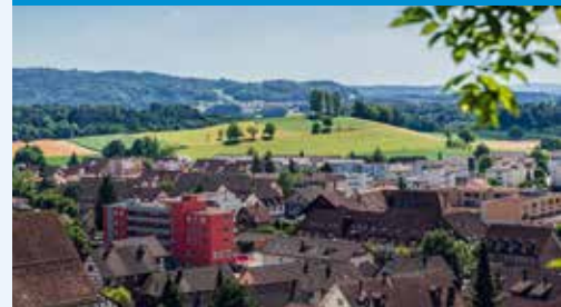
Der Buechberg, schöner und beliebter Aussichtspunkt mit Feuerstelle oberhalb von Fislisbach.