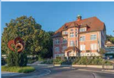
Herzlich willkommen! Kreiselschmuck made in Fislisbach und Gemeindehaus an der Badenerstrasse.

Der Slogan der Gemeinde ist nicht aus der Luft gegriffen – vielmehr ein Ausspruch aus der Bevölkerung.