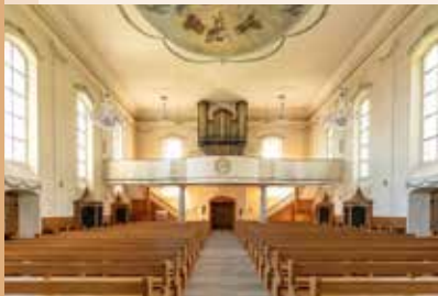
Die katholische Kirche steht seit 1969 unter Denkmalschutz.

Die Konfessionszugehörigkeit der Einwohnerinnen und Einwohner in Fislisbach ist vielfältig. Rund die Hälfte gehört der römisch-katholischen Kirche an, rund 20 Prozent der evangelisch reformierten Kirche. Die weiteren Einwohnerinnen und Einwohner haben eine andere Religionszugehörigkeit oder sind konfessionslos.