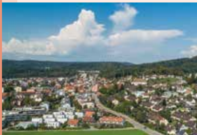
Fislisbachs markanter Dorfkern, mit dem vielfältigen Gewerbe an der wichtigen Verkehrsachse.

Trotz der Nähe zu den Wirtschaftsmetropolen wie Baden oder Zürich, hat Fislisbach eine eigene wirtschaftliche Entwicklung vollzogen.