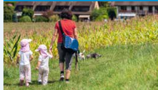
Schnell im Grünen – attraktiv Lage für Familien.