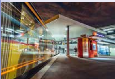
An der Gemeindegrenze zu Mellingen befindet sich die Haltestelle Mellingen-Heitersberg. Ein Pendlerzentrum mit S-Bahn und Postautoanschluss, Park-and-Ride-Möglichkeiten und einer Tankstelle mit Shop.

Die Mobilität in ländlichen Gemeinden hat meist ihre Grenzen, für den täglichen Einkauf oder für den Arbeitsweg ist ein Fahrzeug oft unerlässlich. Den «Foifer und s'Weggli» gibt's allerdings in Fislisbach. Trotz ländlicher Umgebung entspricht das Angebot des öffentlichen Verkehrs demjenigen einer Stadt.