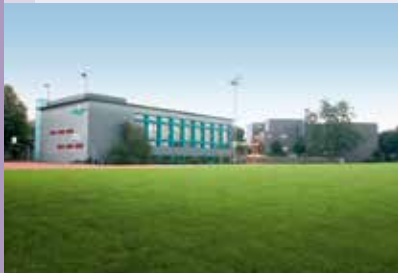
Die zentral gelegene Schulanlage mit dem Sportplatz Leematten

Mit den Kindergärten Moosäcker und Leematten sowie der Schulanlage Leematten stehen unserem Nachwuchs grosszügige und moderne Schulanlagen mit Innen- und Aussensportplätzen zur Verfügung.